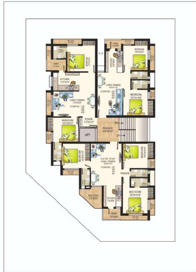
TYPICAL FLOOR PLAN