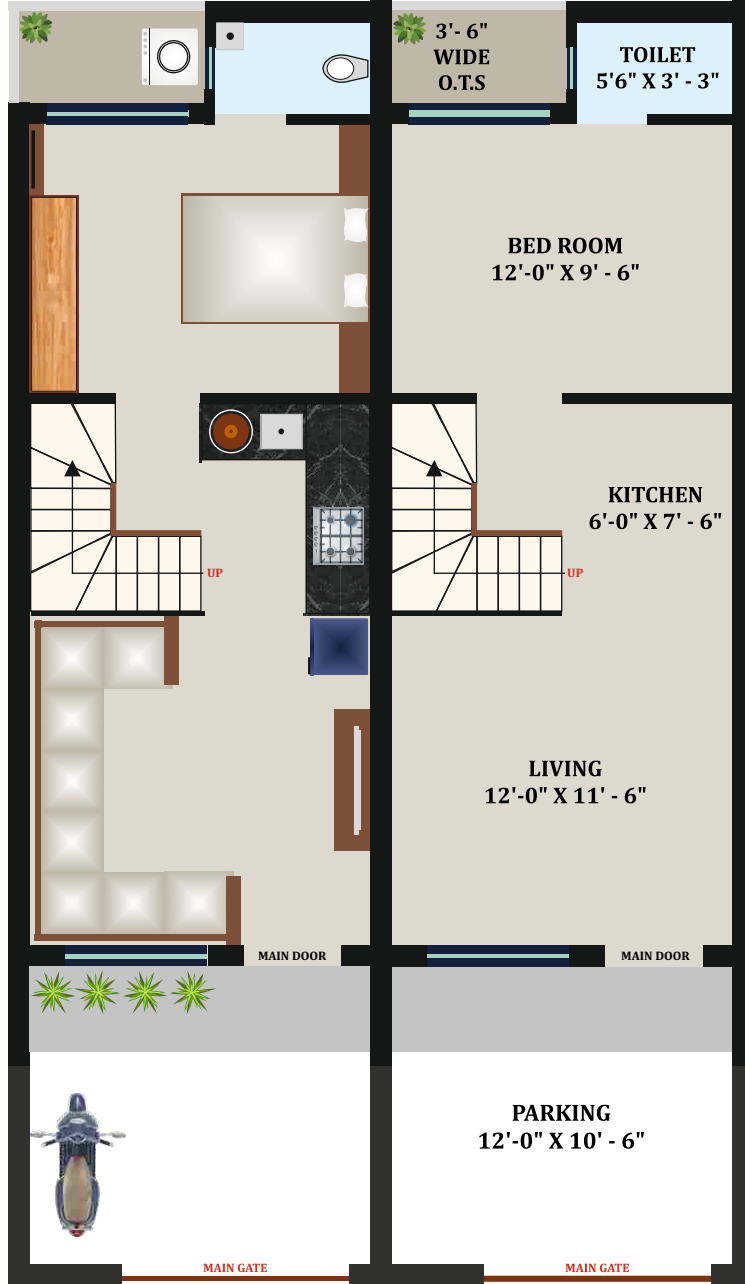
-----25' WIDE ROAD----- GROUND FLOOR PLAN